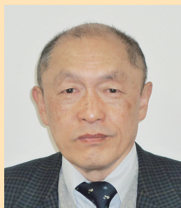
臨床薬学実務教育室 助教

える配属学生達との共同成果であり、その研究過程で、体系的に学ぶ「科学」する姿勢と「深く考察する」という研究の醍醐味を学生と共有するという幸せに浴することができました。ここに、心よりの感謝の意を表明したいと思います。また、40年間、教員活動を継続できたのは、薬学部在職された多くの教職員のご支援の賜物であり、ここに厚くお礼を申し上げます。薬学6年制導入など社会要請に沿って、徳島大学薬学部は何度も組織改編を行ってきました。今後、本学部が大きく飛躍しますよう祈念して、退職の挨拶とさせていただきます。