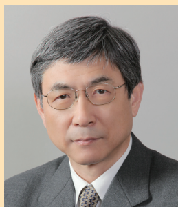
分子情報薬理学分野 教授