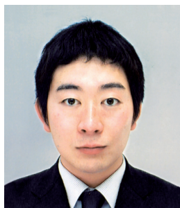
生薬学分野 准教授