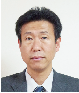
医薬品情報学分野 准教授