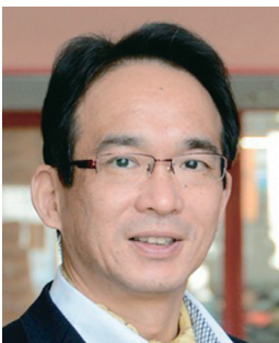
徳島大学薬学部長