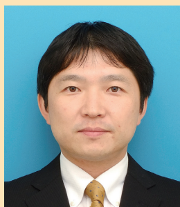
薬物動態制御学分野 兼 がんと代謝学分野 教授