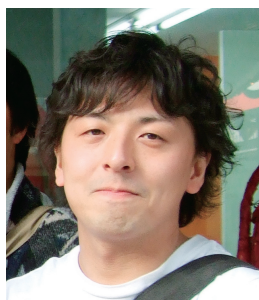
医薬品病態生化学分野 助教